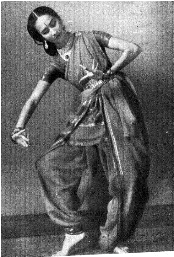
भरतनाट्य नृत्यपद्धति [ 'अनामिका' ]